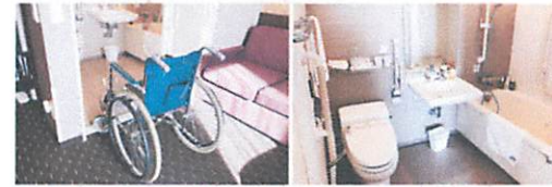
バスルームへの入口幅は約80cmでございます。少人数なし バスルームは浴槽、洗面、トイレが一体のユニットタイプ。